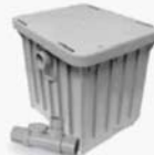
GPM15, Interceptor de grasa