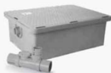
GPM25 LO-PRO, Interceptor de grasa